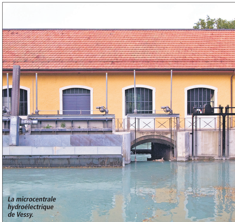
La microcentrale hydroélectrique de Vessy.

L'association Nature, énergies et patrimoines de Vessy a le plaisir d'ouvrir le site de Vessy au public en proposant des visites guidées gratuites le dernier jeudi de chaque mois, jusqu'en septembre.